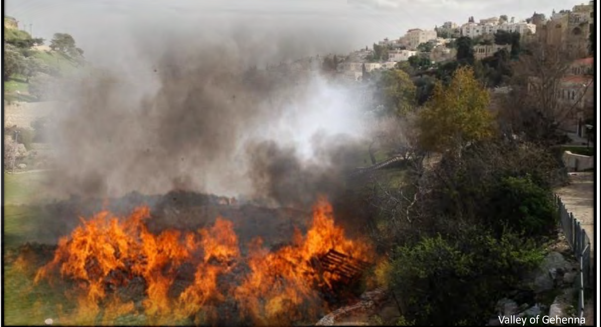
Valley of Gehenna