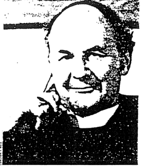
اللاهوتي جون أ. ت. روبنسون عدو الكسل والعلمي.

إن الأدلة على التأريخ ظرفية إلى حد كبير، مستمدة من التحليل الداخلي للكتب. ولكن هناك بعض التواريخ الخارجية التي يمكن الإعتماد عليها. فقد علم المؤرخون منذ عقود أن غالليون كان والياً على أخابية عامي 51 و52 م. وكان بولس يقف (أمامهم جميعاً) (أعمال 18). لذا فإن الكثير من التسلسل الزمني لبولس لقد بدأت مسيرة القديس بطرس في الإندثار. وكان الحدث الأكبر هو موجة الإرهاب ضد المسيحيين التي اندلعت بين حرق روما (يوليو 64) وانتحار الإمبراطور نيرون (يونيو 68)، والتي ربما مات خلالها بطرس وبولس. يعتقد روبنسون أن هذا هو السياق المنطقي لكتب العهد الجديد التي تتناول الاضطهاد، مثل رسالة بطرس ورؤيا يوحنا. هناك تفصيل مثير للإهتمام: تقول رؤيا يوحنا 17: 10 أن خمسة ملوك سقطوا والسداس